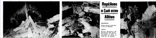
Παρέλυσε η ζωή στην Αθήνα