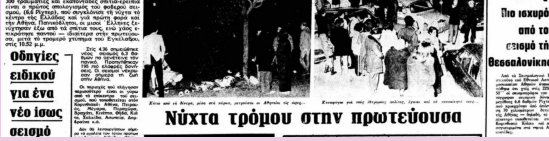
Νύχτα τρόμου στην πρωτεύουσα